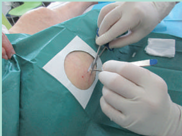
FIGURE 4 : Retrait des pastilles à la face antéro-externe de cuisse, après anesthésie locale.