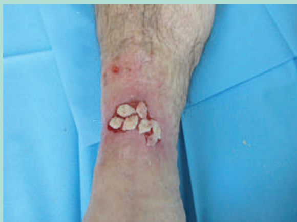
FIGURE 8 : Pastilles déposées sur toute la surface de la zone receveuse.