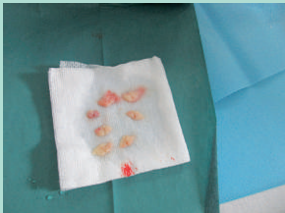
FIGURE 6 : Dépôt des pastilles sur une compresse imbibée de sérum physiologique.