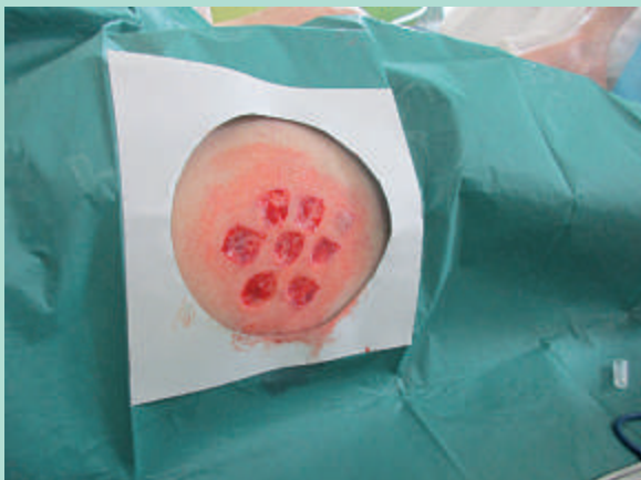
FIGURE 5 : Zone des prélèvements des pastilles.