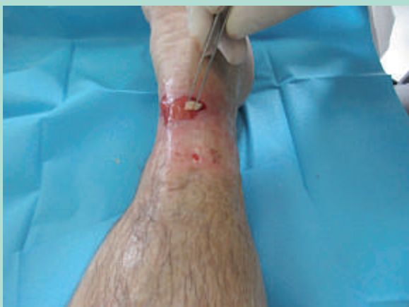
FIGURE 7 : Dépôt des pastilles sur la zone receveuse (ulcère).