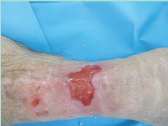
FIGURE 3 : Ulcère veineux après une préparation adéquate.