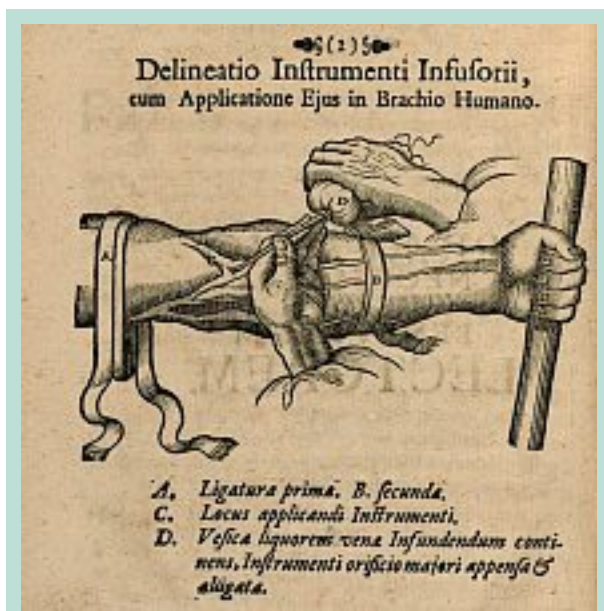
FIGURE 1 : Technique d'infusion en 1664.

En 1661, J.S. Elscholtz injecte à l'aide d'une canule et d'une poire de l'eau de plantain (modeste plante des prairies) à trois soldats victimes d'abcès ou de scorbut et qui guérissent. C'est l'infusion médicamenteuse que l'on pratique généralement après dénudation de la veine [3].