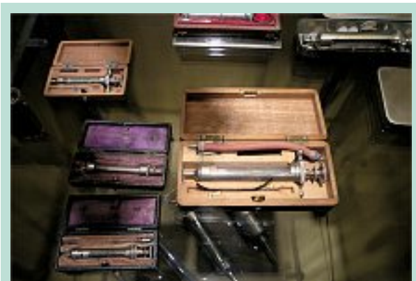
FIGURE 11 : Seringues du XIX e siècle. Musée histoire de la médecine, Paris.

Rapide, efficace, pas cher et ne perturbant pas la vie quotidienne du patient, telle sera la technique du futur.