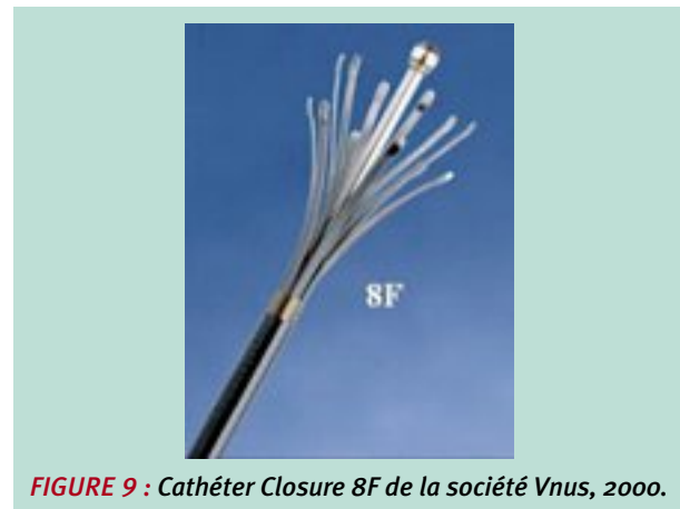
FIGURE 9 : Cathéter Closure 8F de la société Vnus, 2000.

Les premiers cathéters de 6 ou de 8F commercialisés comportaient plusieurs électrodes bipolaires.